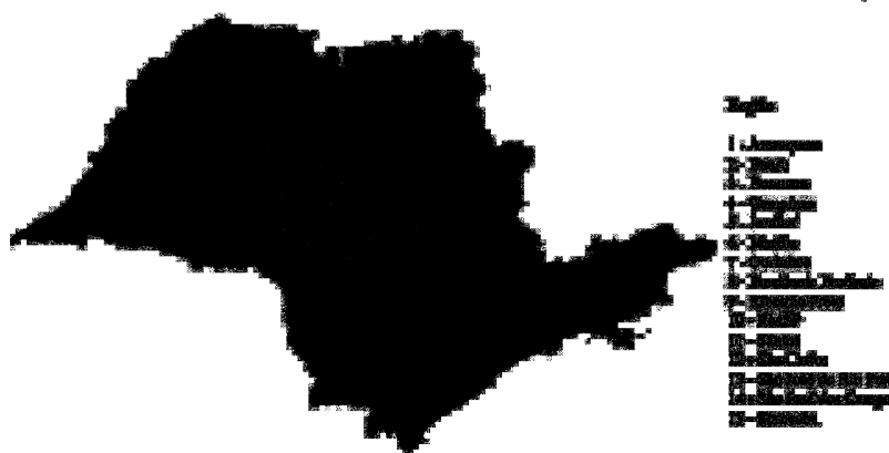
Figura 1 - A rede de municípios do estado de São Paulo