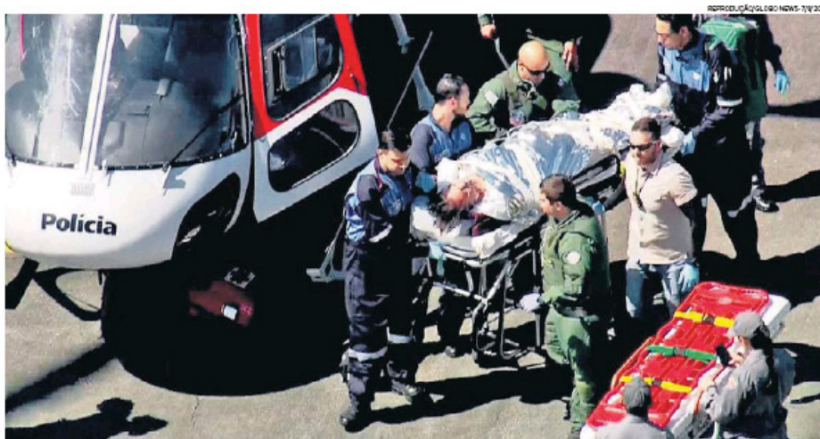
São Paulo. Bolsonaro no Aeroporto de Congonhas, de onde seculu para o Hospital Albert Einstein, na sexta-feira passada

O que se segue nos dias seguintes é uma profusão de imagens e textos que só cobrem o estado de saúde Bolsonaro. As posições dos outros candidatos sobre o atentado, comunicados oficiais sobre violência. Se Bolsonaro já era pauta quase diária, agora tornou-se o mote dos jornais. No dia 8 de setembro O Estado de S. Paulo dedica suas três páginas inteiras do editorial de política à Bolsonaro. Nos dias seguintes a cobertura segue massiva. EM 10 de setembro a cobertura é sobre debate da TV Gazeta/ Estado/ Rádio Jovem Pan/ Twitter. Mas a manchete é “Candidatos evitam ataques e defendem pacificação”. Na capa, a imagem de Bolsonaro na cadeira de hospital não deixa seu nome ser esquecido. Na editoria de política, a cobertura de manifestação pró-Bolsonaro. Em 11 de setembro a capa é que os adversários retomaram o tom crítico ao candidato do PSL. Em 12 de setembro a pesquisa Ibope coloca o candidato com 26% e seu nome na capa do jornal. A cirurgia de emergência do candidato é capa do dia 13. Uma imagem de arquivo é utilizada.