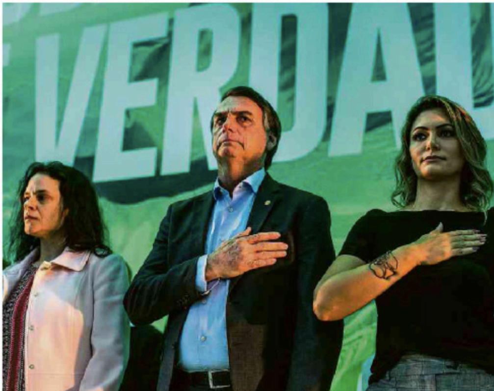
Janaina Paschoal, Bolsonaro e a mulher dele, Michelle, durante a convenção do PSL no Rio

Dubois levanta a questão de que a fotografia, por sua gênese automática é testemunha da existência do referente, mas isso não implica que ela se pareça com ele. Então a fotografia é reconhecida como transformação do real (grifo nosso). Segundo o autor, este é o discurso do código e da desconstrução. A partir de então, tentou-se mostrar que a fotografia não é um espelho neutro, mas que é utilizada como um instrumento de transposição, de análise, de interpretação e até de transformação do real. Entendemos que a imagem fotográfica é uma forma de representação do real. Também é aceita como prova do real.