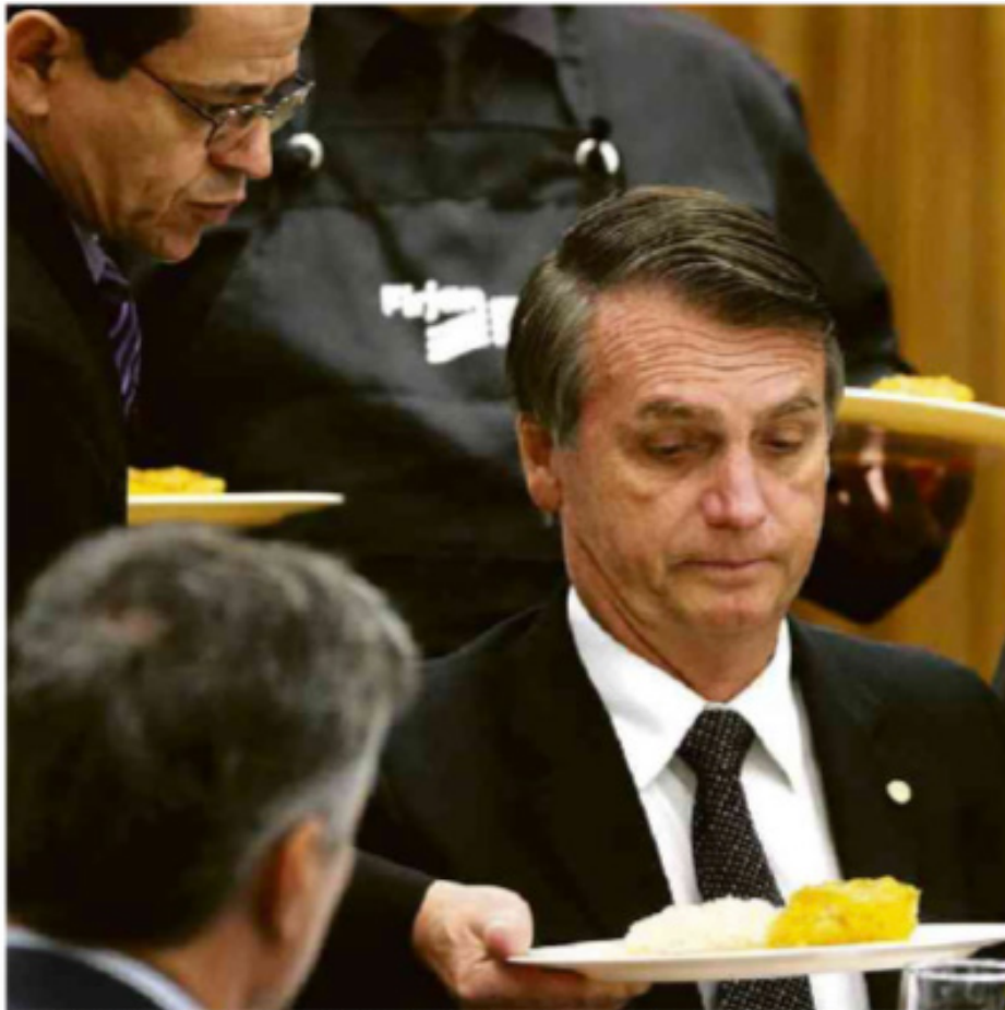
Jair Bolsonaro em almoço na Federação da Indústria do Estado do Rio