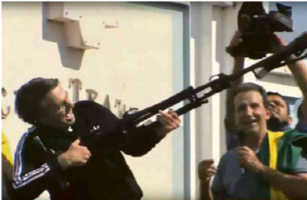
Presidenciável Bolsonaro simula fuzilamento com um tripé de câmera no Acre