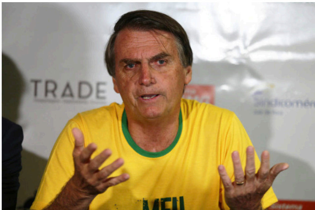
Jair Bolsonaro em Juiz de Fora em 6 de setembro, dia do atentado

A fotografia de 8 de setembro da Folha segue sendo reutilizada na construção da imagem do candidato. A questão nessa imagem é a reiterada construção da fragilidade em Bolsonaro. Num segundo momento, a polêmica da mão sinalizando uma arma. Dois constructos negativos. A fotografia nunca é meramente ilustrativa. Porém, outro caso de reutilização da imagem acontece no Estadão em 14 de setembro. Com o título “Internação de Bolsonaro fragiliza sua campanha” a imagem reutilizada não reforça essa ideia. É de arquivo, do dia do atentado, mas uma imagem de perfil.