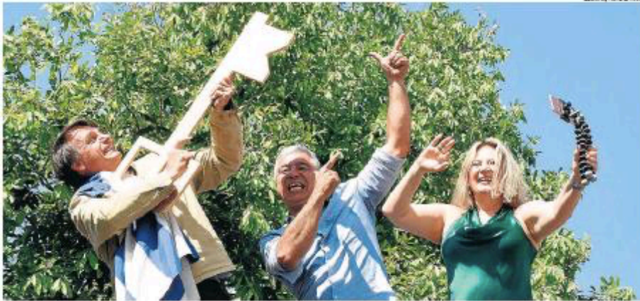
Araguaia. Bolsonaro segura a chave da cidade como uma metralhadora ao lado de Major Olimpio e Joyce Hasselmann, candidatos ao Senado e à Câmara