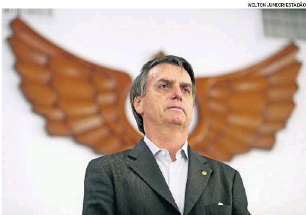
Campanha. Bolsonaro (PSL) durante visita ao Clube da Aeronáutica (RJ)