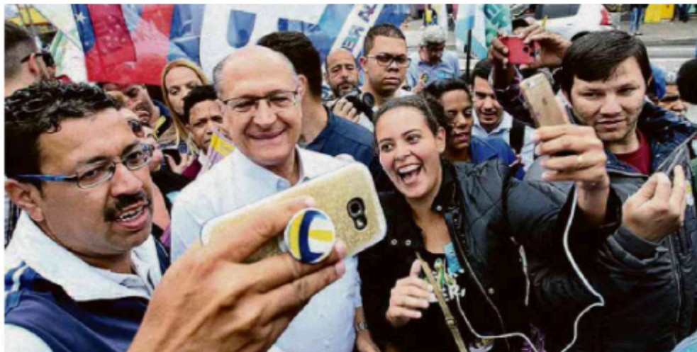
Geraldo Alckmin durante caminhada no Campo Limpo, Zor Sul de São Paulo