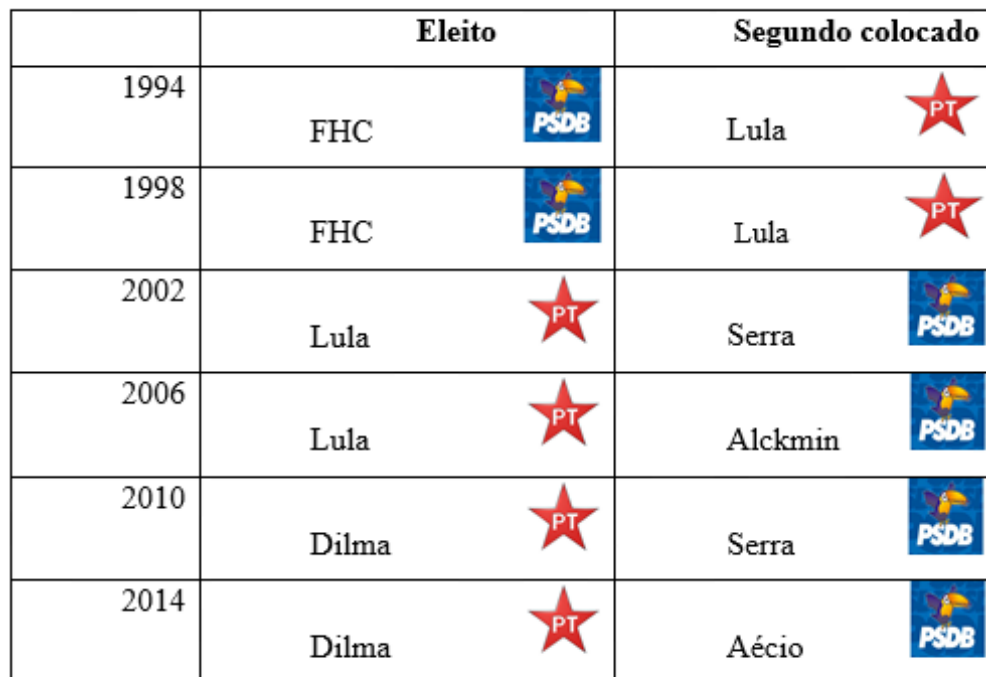
Quadro 1- Dois primeiros colocados nas eleições presidenciais (1994-2014)

Em disputa acirradíssima, Dilma Rousseff venceu Aécio Neves no segundo turno e confirmou a hegemonia petista verificada nos últimos pleitos, sempre no embate direto com os candidatos indicados pelos tucanos. E 2014 sinalizou, uma vez mais, para a polarização entre petistas e tucanos nas eleições presidenciais brasileiras, que chegou aos vinte anos.