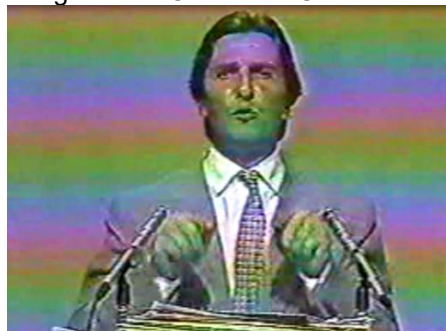
Figura 12 - Candidato Collor