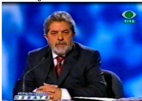
Figura 6 - Candidato Lula