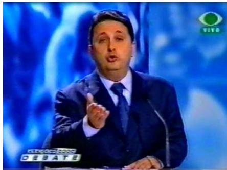
Figura 18 - Candidato Garotinho