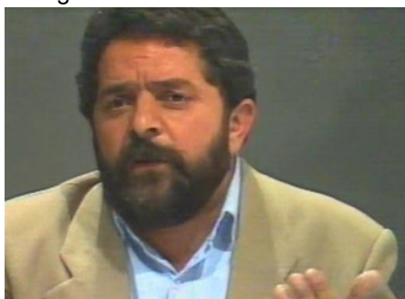
Figura 16 - Candidato Lula