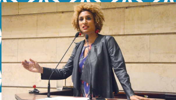
MARIELLE FRANCO | 2018