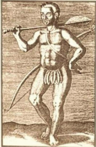
TIBIRA DO MARANHÃO 1614