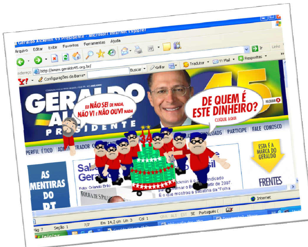
Figura 2 – Utilização de ícones animados no site de Geraldo Alckmin.

As diferenças ficaram por conta da periodicidade de atualização dos websites , quesito no qual a e-campanha de Geraldo Alckmin se destacou, com um número maior de notícias, atualizadas várias vezes ao dia, assim como a disponibilização de ícones animados e sentido de humor/ironia. Cabe ressaltar esses últimos elementos corresponderam ao sentido de “diversão” e a um estilo de entretenimento na estratégia de campanha, o que demonstrou uma tentativa para atrair os eleitores mais jovens (ver figura 2).