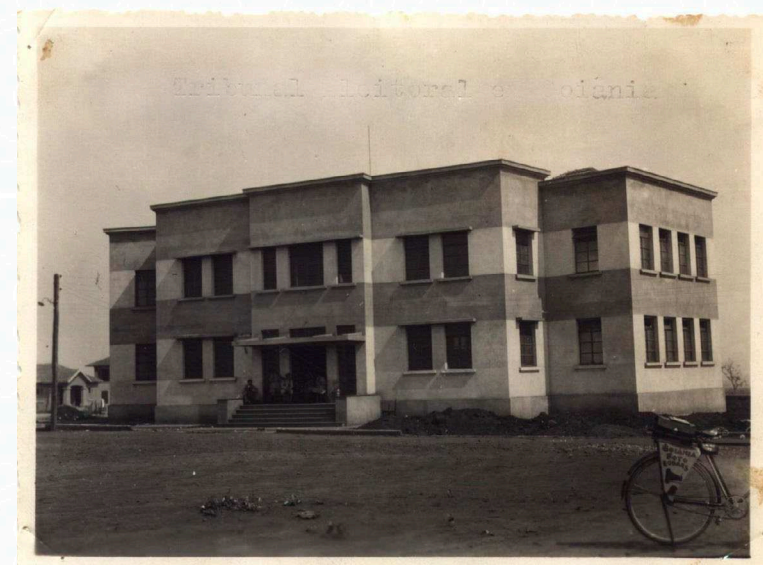
Prédio do Tribunal Regional Eleitoral de Goiás (TRE/GO), em 1937.