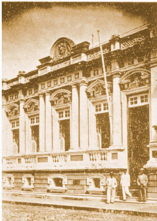
Primeira sede do Tribunal Regional Eleitoral do Ceará (TRE/CE), que funcionou, de 1932 a 1934, em 1937 e de 1945 a 1947, no Palácio da Justiça, situado à Rua Barão do Rio Branco, n. 1.200, Centro de Fortaleza.