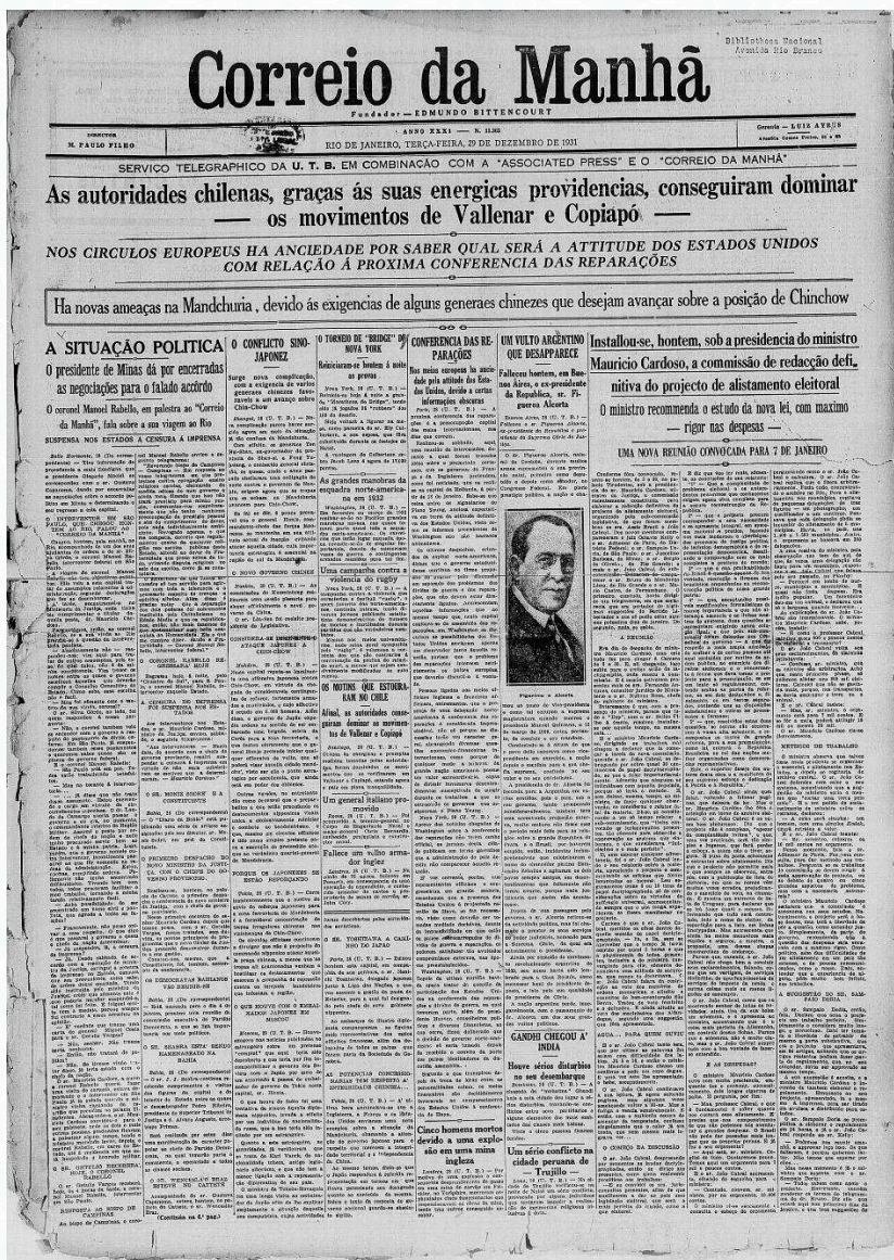
Primeira página do jornal Correio da Manhã noticiando a instalação, sob a presidência do Ministro Cardoso, da comissão definitiva de redação do projeto de alistamento eleitoral. Fonte: Correio da Manhã (RJ), Ano XXXI, n. 11363, 29 de dezembro de 1931, p. 1. Acervo da Fundação Biblioteca Nacional — Brasil. Disponível em: http://memoria.bn.br/DocReader/docreader.aspx?bib=089842_04&pasta=ano%201931&pesq=as%20autoridades%20chilenas&pagfis=9914 .

Dentre as mudanças concebidas nessa reta final de revisão do anteprojeto, destacam-se duas medidas que comprometeriam a autonomia da Justiça Eleitoral. A primeira delas ampliou de dois para três o número de membros do Superior Tribunal Eleitoral, que seriam indicados diretamente pelo Governo Provisório. Como essa esfera máxima de poder na estrutura da Justiça Eleitoral contaria com oito membros, a alteração ampliava o poder do Governo Provisório sobre aquela arena decisória, garantindo-lhe, na prática, mais de um terço de correligionários na Corte de antemão.