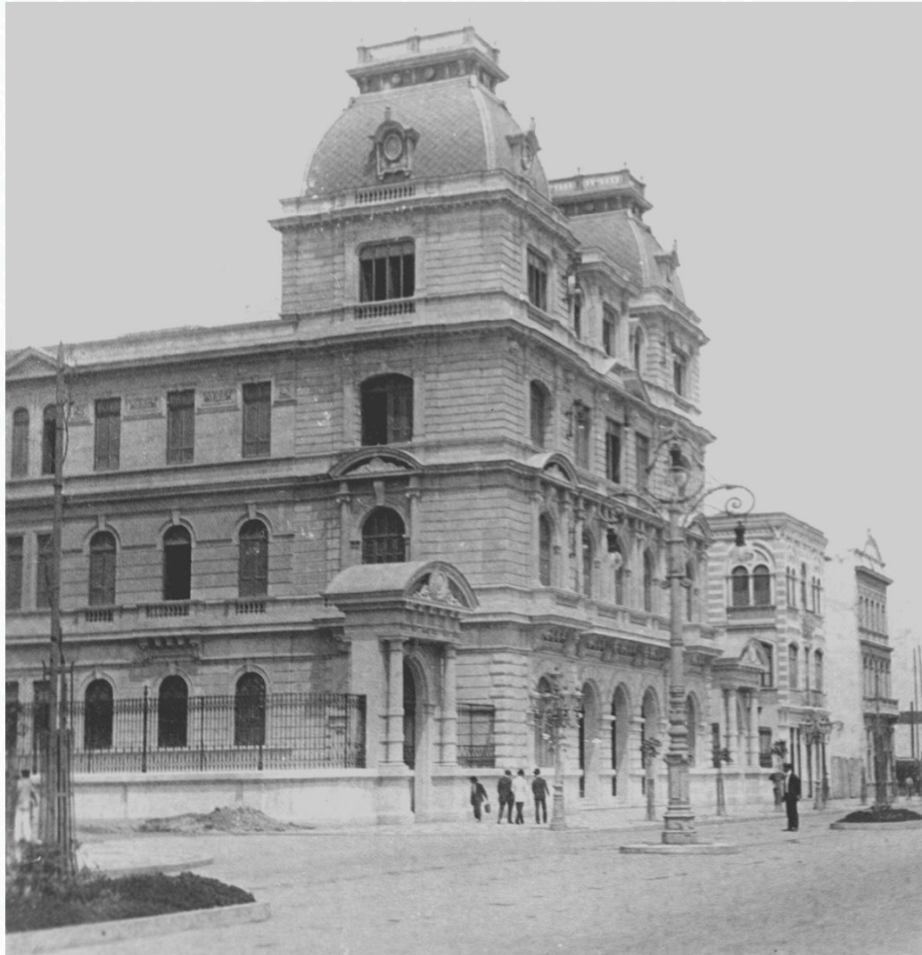
Fachada do primeiro Edifício-Sede do Tribunal Superior da Justiça Eleitoral, que funcionou, entre 1932 e 1935, na Avenida Rio Branco, no Município do Rio de Janeiro.