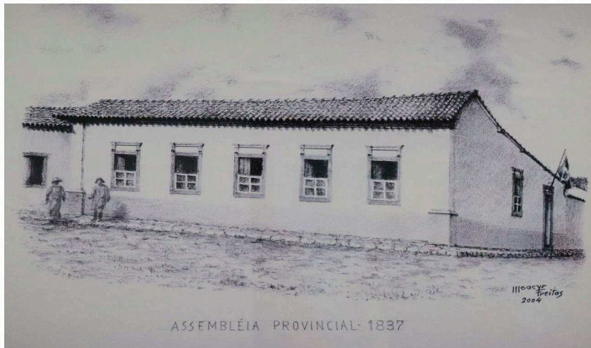
Ilustração da primeira sede do Tribunal Regional Eleitoral de Mato Grosso (TRE/MT), no antigo edifício da Assembleia Legislativa do Estado de Mato Grosso, à Rua Pedro Celestino.