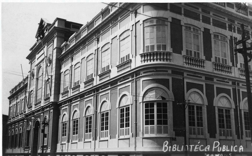
Primeira sede do Tribunal Regional Eleitoral do Amazonas (TRE/AM), que funcionou nas salas do pavimento superior da Biblioteca Pública do estado, na Rua Barroso, n. 57, esquina com a Avenida Sete de Setembro, no centro de Manaus.