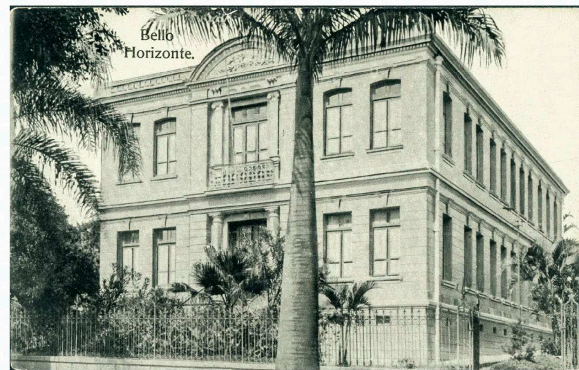
Primeira sede do Tribunal Regional Eleitoral de Minas Gerais (TRE/MG), no prédio do antigo Senado estadual, localizado na então Praça da República (atual Praça Afonso Arinos).