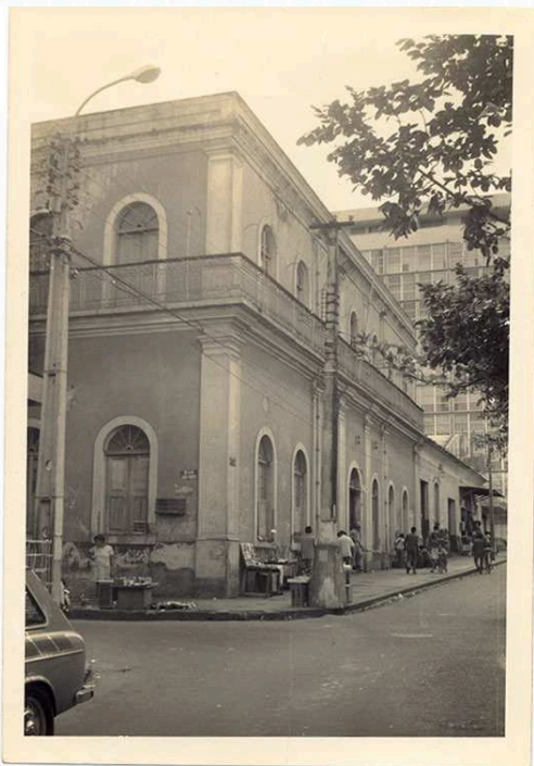
Primeira sede do Tribunal Regional Eleitoral do Piauí (TRE/PI).