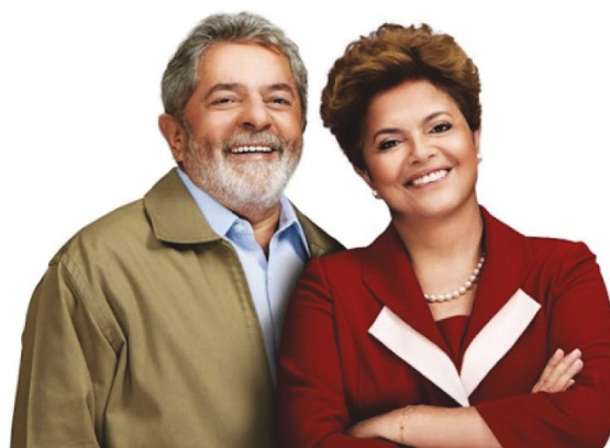
Figura 3: Lula e Dilma.