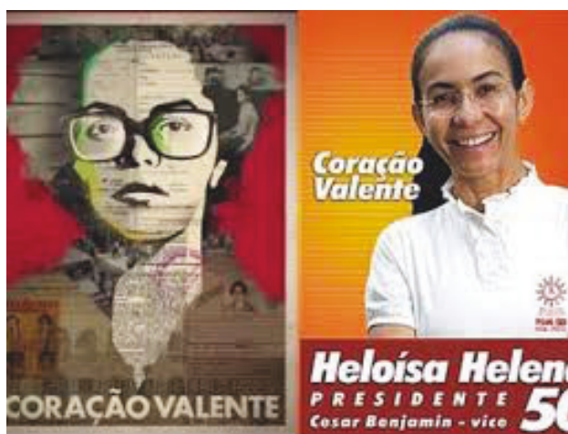
Figura 2: Dilma e Heloísa: “corações valentes”

Na campanha de Luciana Genro, que se apresentara como advogada na luta pelos direitos humanos e como a voz dos valentes jovens do junho de 2013, a guerreira também estava presente, surgindo na defensora dos oprimidos e de uma democracia real, alertando que “nada deve parecer impossível de mudar”.