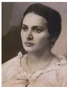
Figura 2 - Retrato de Alzira Soriano, primeira mulher a ser eleita para um cargo executivo no país.

A respeito da participação feminina na política brasileira, destaca-se Luiza Alzira Soriano Teixeira, como pode ser observado na Figura 2. Natural do Rio Grande do Norte, foi a primeira mulher a ser eleita prefeita no Brasil e na América Latina, em 1928, antes mesmo da conquista do direito de voto feminino no Brasil.