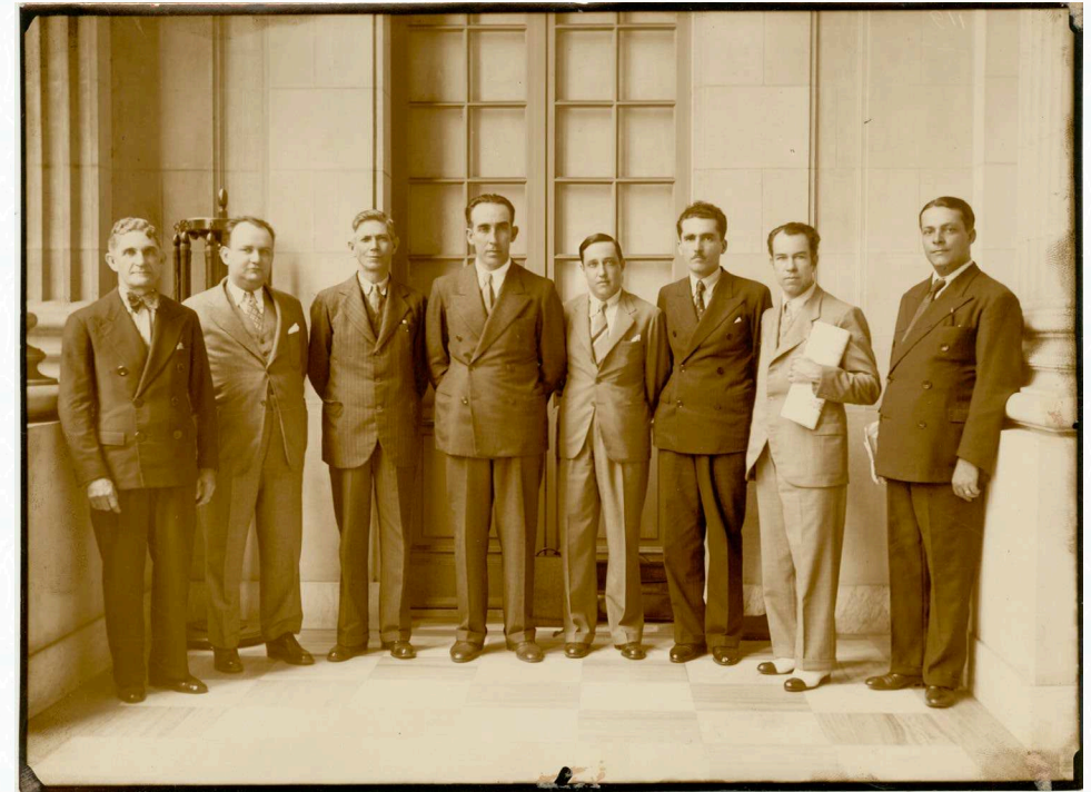
Comissão de Segurança Nacional, Câmara dos Deputados (1934).

No dia 17 novembro de 1934, cerca de quatro meses após a criação da nova Constituição e do início do mandato de Getúlio Vargas, o advogado Clóvis Dunshee de Abranches enviou uma carta para a Câmara criticando a repressão do governo contra os movimentos sociais. Disse que a Constituição garantia aos trabalhadores “a sindicalização, o direito de reunião e a livre manifestação do pensamento”, porém o que se via nas ruas naquele momento era que “os sindicatos têm sido depredados, as reuniões são dissolvidas a bala e a gás lacrimogênio, os trabalhadores são esbordados e assassinados, e até seus advogados são desacatados e presos”.