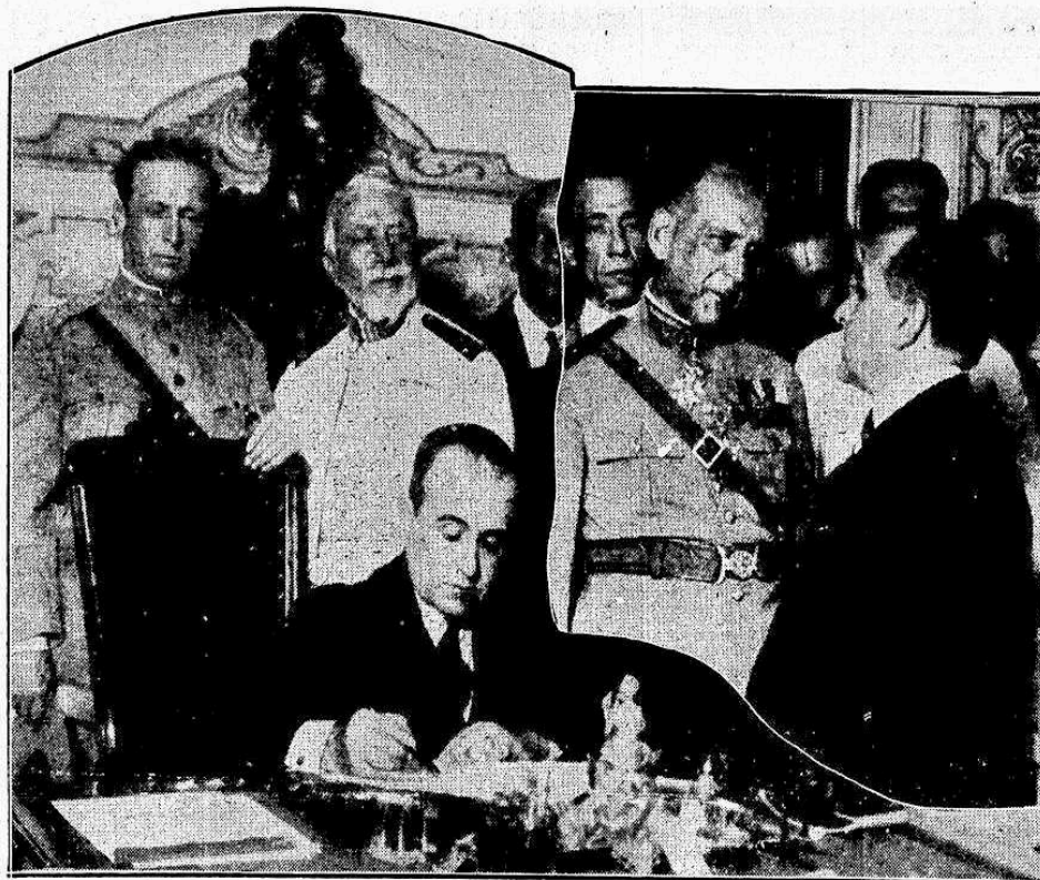
Dois documentos photographicos historicos do presidente Getúlio Vargas, fixados logo após á sua chegada ao Catete, vindo do Sul, como chefe da forças revolucionarias, em outubro de 1930, vendo-se á esquerda o então chefe do governo provisório, tendo ao lado o general Flores da Cunha, assinando os seus primeiros decretos — os da nomeação dos seus ministros, e á direita, conversando com o general Licite de Castro, o seu primeiro ministro da Guerra

Getúlio Vargas assinando seus primeiros decretos logo após tomar posse como presidente da República.