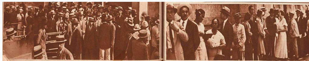
Fila de eleitores em São José (à esquerda) e na Praça da Bandeira (à direita), no Rio de Janeiro.