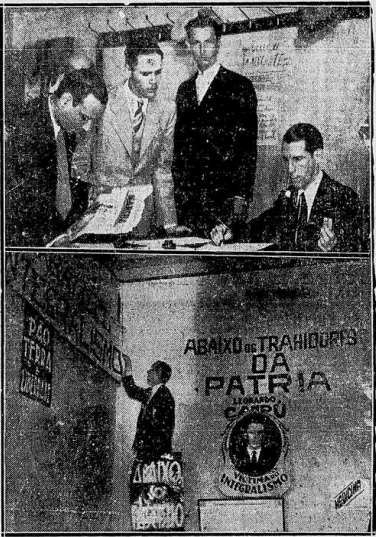
Dois aspectos tomados na A. N. L., durante a diligencia policia