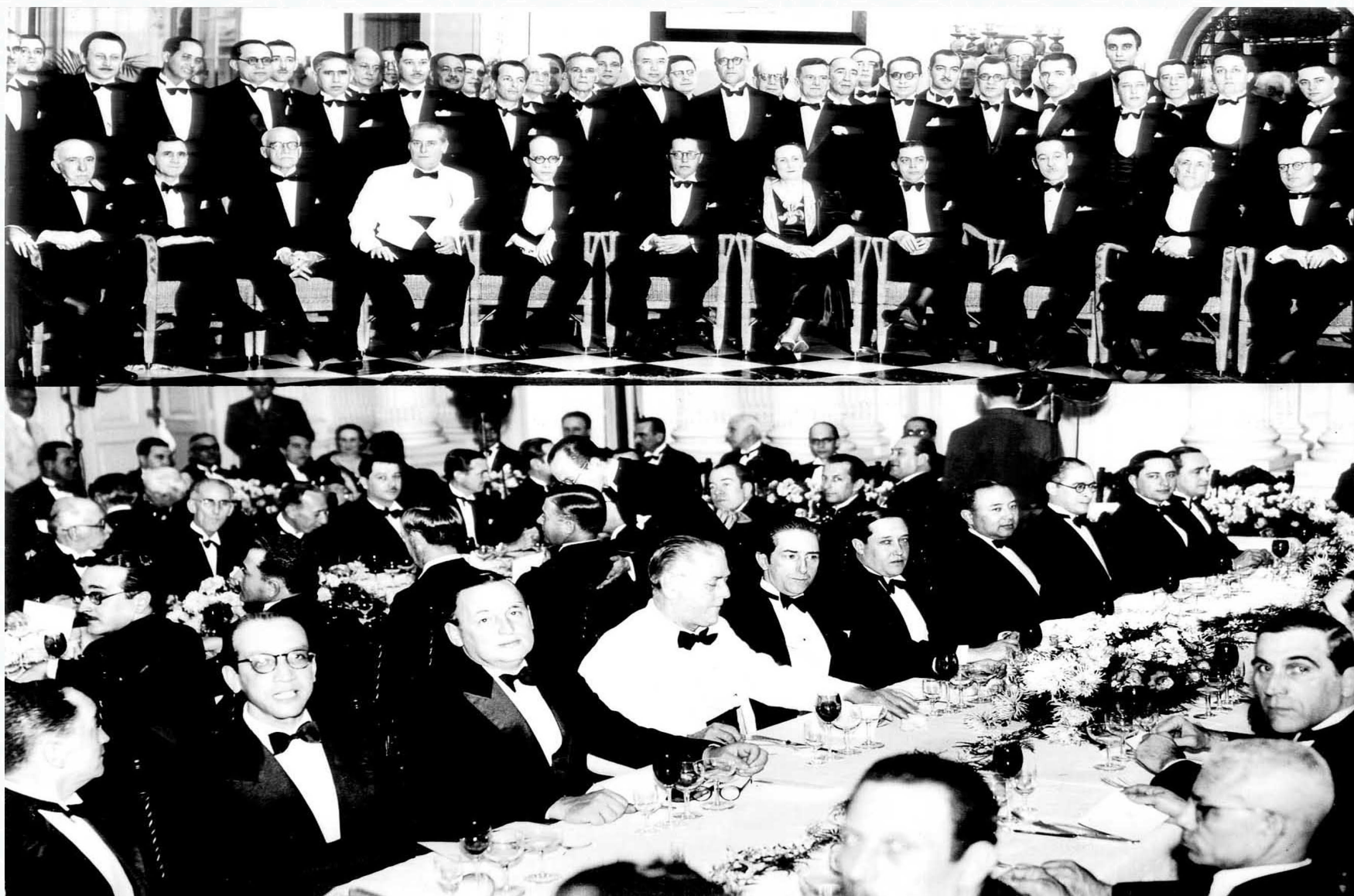
Augusto do Amaral Peixoto, Gustavo Capanema e outros em banquete de confraternização da Câmara dos Deputados, entre janeiro e março de 1936.