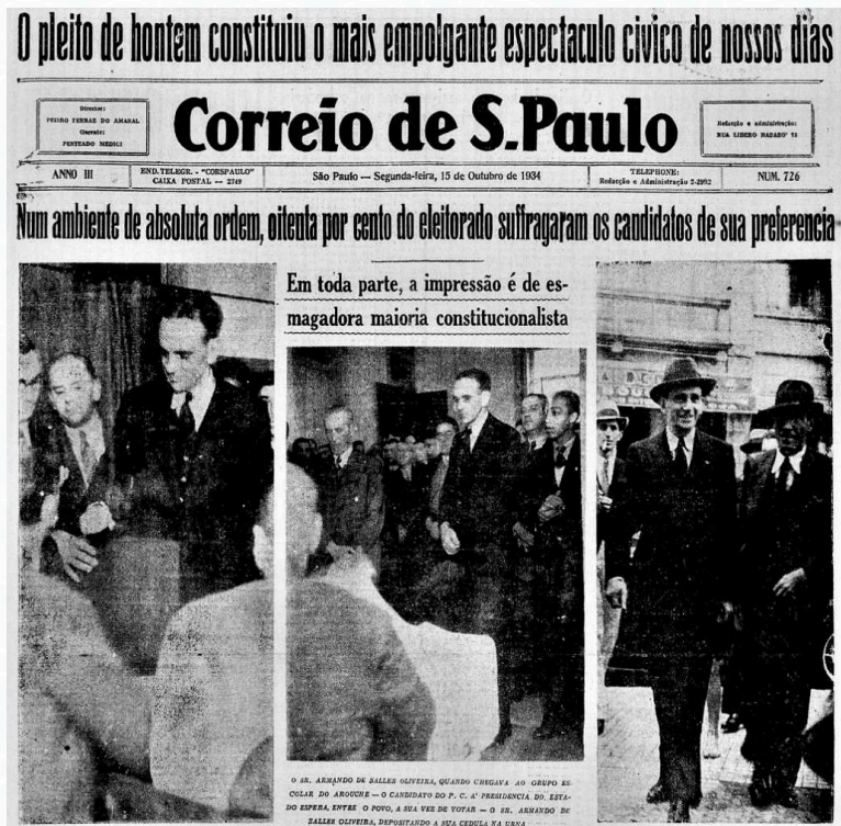
Fotografias do dia da eleição em São Paulo com destaque para Armando de Salles Oliveira.