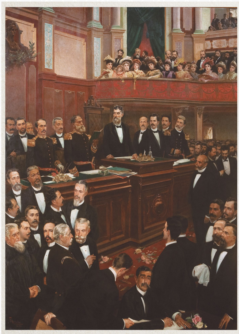
No quadro Compromisso Constitucional que Aurélio de Figueiredo pintou em 1891, Deodoro da Fonseca faz o protocolar discurso de jurar e manter a Constituição, juras que seriam quebradas poucos meses depois. A maior parte dos congressistas é retratada com indiferença em relação ao rito. Imagem: Museu da República/Ibram/Ministério da Cidadania nº 13/2019.

A surpresa maior ficou para a eleição do vice-presidente. O candidato da chapa de Deodoro, o Ministro da Marinha, Eduardo Wandenkolk, amargou uma derrota acachapante, conseguindo apenas 57 votos, conquanto Floriano Peixoto, vice da chapa de Prudente, foi eleito pelos votos de 153 parlamentares. Ainda que a escolha de Deodoro tenha sinalizado opção um tanto cautelosa pela manutenção da ordem, a eleição de Floriano foi inequívoco sinal de força da oposição, que pretendia criar mecanismos que moderassem eventuais ímpetos ditatoriais do presidente.