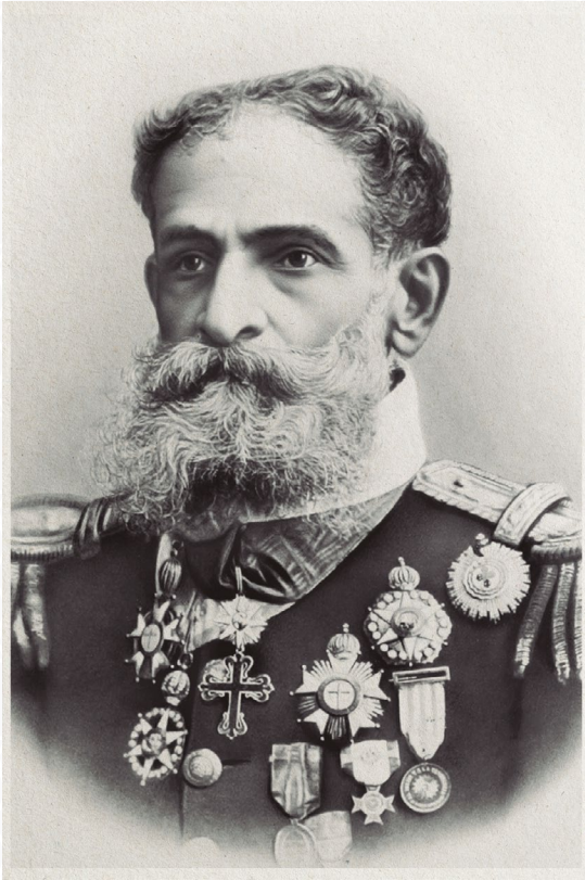
Nasceu em Anadia, pequena Vila da então província de Alagoas, em 5 de agosto de 1827. Era filho do tenente-coronel Manoel Mendes da Fonseca e de Dona Rosa Maria Paulina da Fonseca.