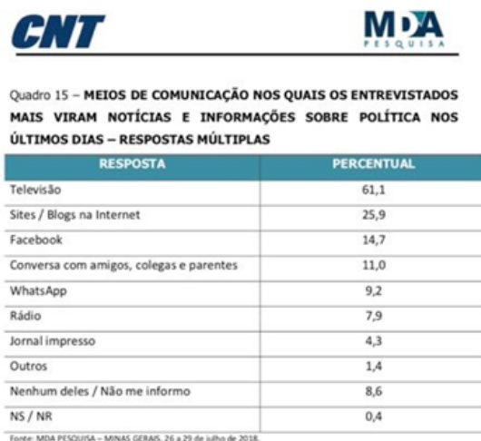
Figura 5 – Quadro 15 da pesquisa CNT/MDA nº MG-04357/2018