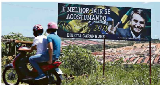
Outdoor a favor de Bolsonaro inaugurado em período pré-eleitoral na cidade de Garanhuns (PE) Imagem: Assis - 10 de maio 2018 / Folhapress

O número total pode ser bem maior. Um militante de Bolsonaro que inaugurou a