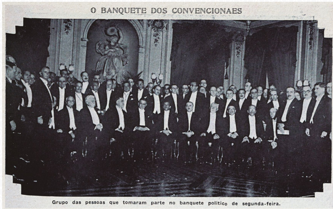
Imagem extraída da Fon-Fon de 2.1.1926, retratando os convencionais no banquete do Automóvel Club, em ocasião da sucessão presidencial daquele ano, no qual foi anunciada a candidatura de Washington Luís. Acervo da Fundação Biblioteca Nacional – Brasil.

Resta claro que tal competição se dava nos limites das próprias oligarquias hegemônicas, que não se limitavam aos mineiros e aos paulistas, mas ao conjunto mais amplo de políticos, provindos ou de outros estados fortes (como o Rio Grande do Sul, Rio de Janeiro, Bahia e Pernambuco), ou de estados não tão poderosos, mas detentores de algumas lideranças individuais de forte inserção nacional (como Lauro Sodré/PA, Joaquim Murtinho/MT, Lauro Miller/SC). Portanto, a real competição eleitoral entre os presidenciáveis se dava previamente às eleições. Uma vez alçado um nome com consistente apoio da maior parte das oligarquias, a sua eleição estaria garantida.