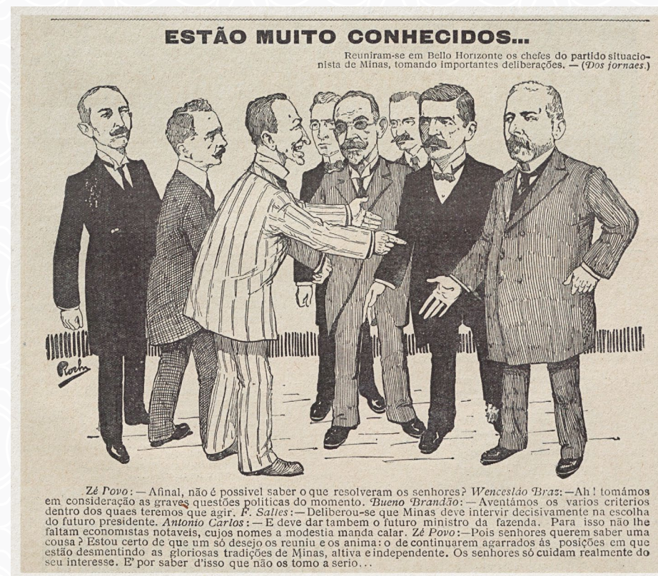
Charge de O Malho de 7.12.1912, p. 49, retratando as conversas entre os chefes mineiros para influenciar a escolha do futuro presidente.

Há que se destacar a proeminente participação do Exército como ator político ao longo de todo o período, bem como o papel do Parlamento na definição das candidaturas presidenciais e na composição dos ministérios.