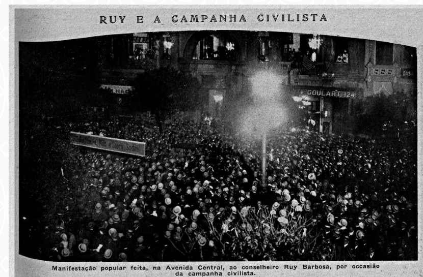
Neste dia, a Fon-Fon dedica uma série de artigos à vida política de Rui Barbosa em ocasião de seu falecimento. Fon-Fon de 10.3.1923, p. 43.

Ao acompanhar os processos eleitorais pela imprensa do período, seja ela escrita, seja ilustrada, percebe-se uma alusão constante aos processos eleitorais, o que se dava com fins distintos. O primeiro era defender a candidatura de algum líder que tivesse controle sobre o jornal; o segundo era incentivar a participação do povo, atuando de forma pedagógica, com o fim de contribuir para maior consciência em torno da importância do voto, do combate às fraudes e da corrupção. Os meetings , que se assemelhavam aos comícios do período, contribuíam para que a população, mesmo ausente do processo, se informasse sobre as disputas ou delas participasse, mesmo sem direito a voto. Portanto, não se pode contestar o caráter mobilizador dos processos eleitorais, mesmo que o número de eleitores fosse diminuto.