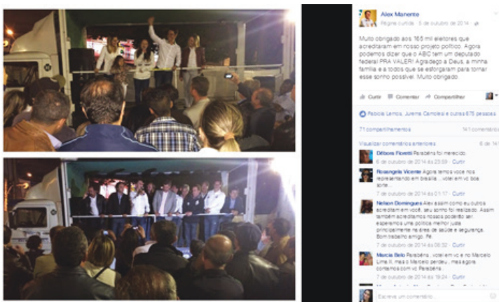
Figura 4 – Exemplo de afetividade – Alex Manente.

Rourke et al. (2001) destacam que a demonstração de emoção, humor e sentimentos é comum em mensagens afetivas. Assim, ao se analisar a postagem veiculada na fanpage de Alex Manente no dia 5 de outubro, após o resultado da eleição (Figura 4), é possível notar o humor – o parlamentar fora eleito com a maior quantidade de votos do partido no país e obteve a maior votação da região do Grande ABC.