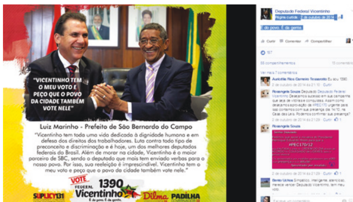
Figura 2 – Exemplo de coesão 1 – Vicentinho.

Seguindo as categorias de presença social de Rourke et al. (2001), é possível observar a coesão nas postagens de Vicentinho no exemplo recortado na Figura 2. As mensagens veiculadas no Facebook do deputado federal usam frases curtas ou nenhuma frase. Por vezes, o texto está incluso na própria imagem manipulada com arte da campanha eleitoral. No primeiro exemplo, veiculado no dia 2 de outubro, a coesão aparece na frase “É do povo. É da gente”, reforçando a mensagem do parlamentar como um candidato que pertence ao povo.