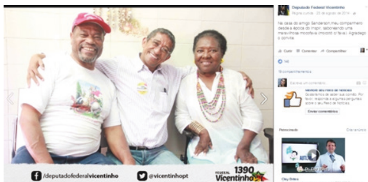
Figura 3 – Exemplo de afetividade 1 – Vicentinho.

O pesquisador Sierra Caballero (2016) 7 indica que as mídias sociais se constroem por meio de vínculos, relações. Tais vínculos parecem mais evidentes nas postagens do deputado federal Vicentinho. Uma das mensagens afetivas da página do parlamentar está ilustrada na Figura 3. De modo diferente da coesão, que usa vocativos para se referir a um participante – como o nome da pessoa –, a mensagem dá o sentido de intimidade entre os personagens, pela forma como se abraçam, parecendo transmitir emoção.