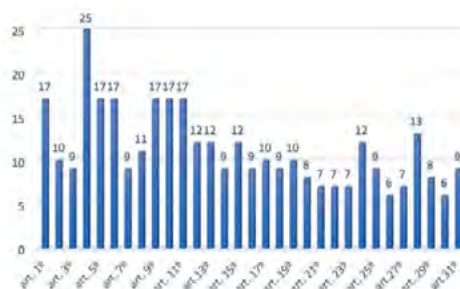
Gráfico 4: Emendas por artigos