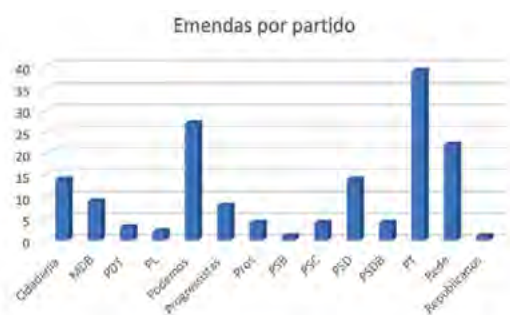
Gráfico 3: Emendas por partido.

No período, os partidos que mais apresentaram emendas foram o PT, com 39, seguido pelo Podemos, com 28, Rede Sustentabilidade, com 22, e PSD, com 14. Os parlamentares que mais assinaram emendas foram Randolfe Rodrigues (Rede/AP) e Rose de Freitas (Podemos/ES), com 15 emendas cada, Jean Paul Prates (PT/RN), 11, Rogério Carvalho (PT/SE), 10, Nelsinho Trad (PSD/MS), 9, e Paulo Paim (PT/RS), Fabiano Contarato (Rede/ES) e Humberto Costa (PT/PE), com 7 emendas cada.