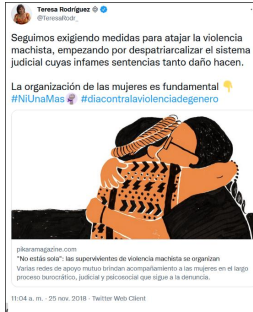
Figura 1 Ejemplo de tuit en los que las mujeres están en el centro