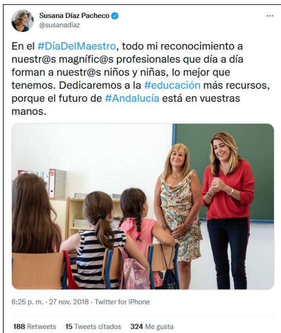
Figura 2 Ejemplo de tuit con uso del lenguaje inclusivo