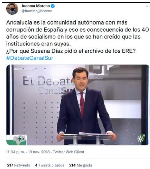
Figura 3 Ejemplo de tuit lenguaje brusco o inquisitivo

Fuente: Cuenta de Twitter oficial del candidato del PP Juan Manuel Moreno Bonilla. Disponible en: < https://twitter.com/JuanMa_Moreno/status/1064640671909335040 >. Acceso en: 1 mar. 2022.