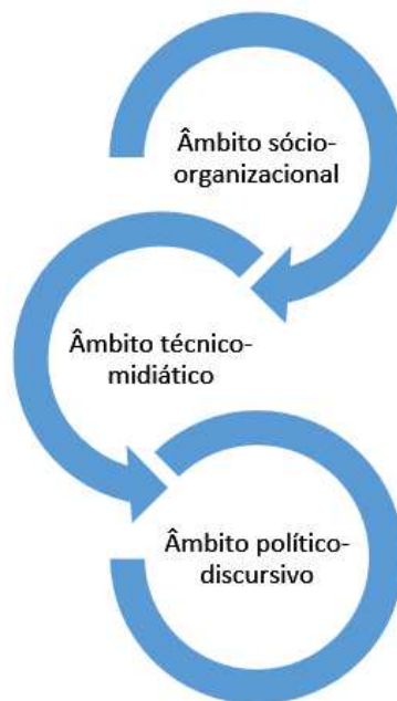
Figura 1 - Esquema de análise dos ambientes da circulação – ou circuito-ambiente