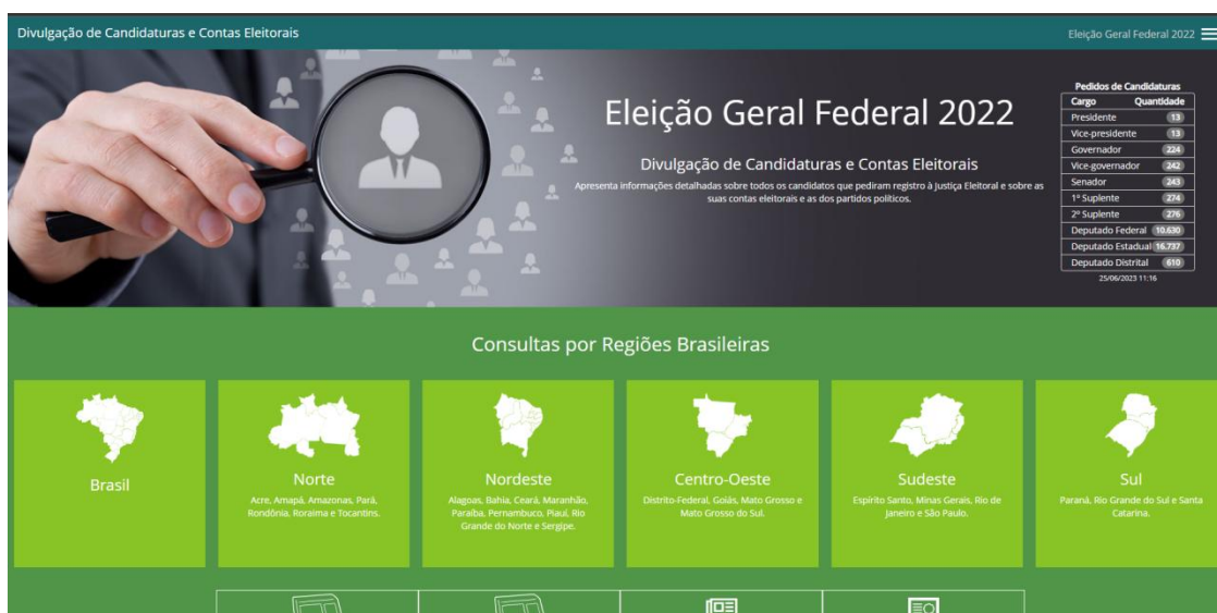
Figura 2 – Portal Divulgação de Candidaturas e Contas Eleitorais

talhadas sobre todos os candidatos que pediram registro à Justiça Eleitoral e sobre as suas contas eleitorais e as dos partidos políticos”.