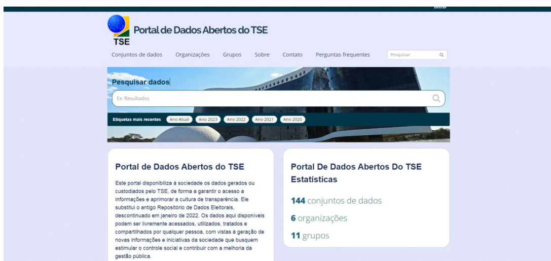
Figura 1 – Portal Dados Abertos

Por meio do “Portal de Dados Abertos do TSE 78 ”, o Tribunal Superior Eleitoral “disponibiliza à sociedade os dados gerados ou custodiados, de forma a garantir o acesso a informações e aprimorar a cultura de transparência”.