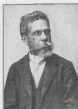
Joaquim Nabuco - 235