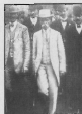
Assis Brasil - 363