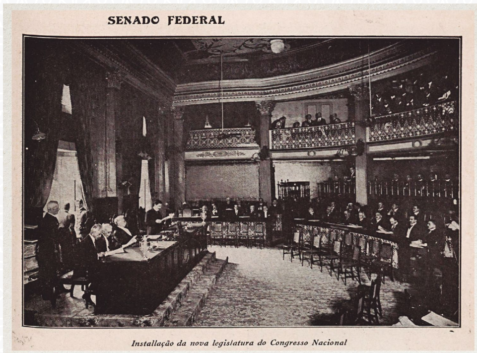
Fotografia da primeira reunião da nova legislatura no Palácio Conde dos Arcos. Careta de 11.5.1918, p. 13.