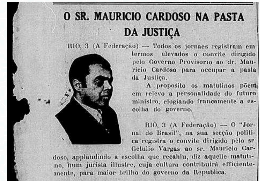
Notícia sobre o convite feito pelo Governo Provisório para que Mauricio Cardoso assumisse a pasta do Ministério da Justiça.

Com a nomeação de Mauricio Cardoso como Ministro da Justiça, o Presidente Getúlio Vargas fez uma opção política em favor do processo constitucional, em especial na concretização do novo Código Eleitoral. Desse modo, optou por não continuar com o Governo Provisório por tempo indeterminado. Era o momento da “des-ditatorialização”. Nas ditaduras que coexistiam no imediato pós-1930, aquela ancorada no Poder Discricionário, entre marchas e contramarchas, caminhava para entregar a renovação que prometera, acabando com a ditadura da Primeira República.