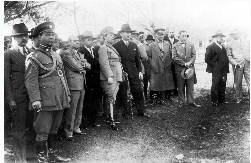
Aspectos da viagem de Oswaldo Aranha ao Rio Grande do Sul, a fim de tratar com os chefes gaúchos as propostas de constitucionalização do país, bem como para expor tanto a situação econômico-financeira brasileira quanto a atuação do Governo Provisório.

República Velha. Em terceiro lugar, ela era transitória , pois terminaria com a reorganização constitucional articulada pelo próprio Poder Discricionário. Por fim, ela era saneadora , porque formularia novas regras eleitorais, que viriam a ser concretizadas no novo Código Eleitoral. Esse sentido de ditadura é semelhante àquele típico da ditadura romana, marcada pela excepcionalidade de uma situação de emergência na qual o ditador tinha poderes amplos, mas não ilimitados, e temporalmente delimitados.