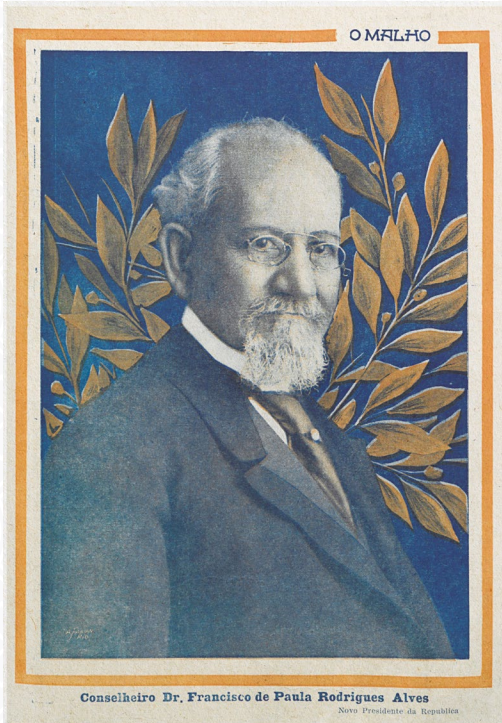
Conselheiro Dr. Francisco de Paula Rodrigues Alves Novo Presidente da República