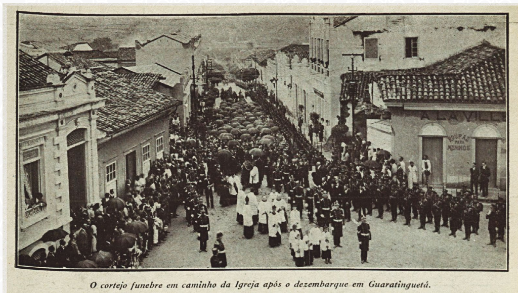
O cortejo funebre em caminho da Igreja após o desembarque em Guaratinguetá.

Curiosamente, a morte também rondou Alves na ocasião de sua primeira eleição para presidente, em 1902. Nesta ocasião, porém, quem faleceu antes de tomar posse foi o seu vice, o mineiro Silviano Brandão. Na primeira situação a morte levou o vice mineiro; na segunda, o titular paulista.