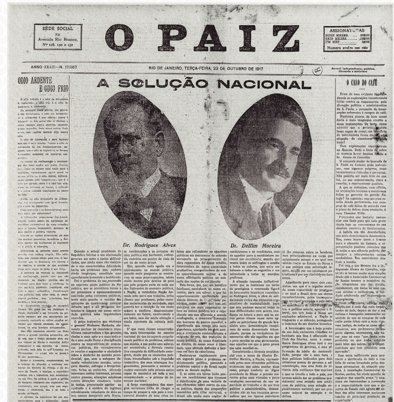
Jornal O Paiz de 23.10.1917 com a notícia da candidatura da chapa Rodrigues Alves/Delfim Moreira.

Apesar de figura bem quista no cenário político, emplacar o nome de Rodrigues Alves como candidato dependeria de acordos, especialmente com os políticos mineiros. Desse modo, a composição da chapa foi “costurada” pelo Presidente de São Paulo, Altino Arantes, e pelo Ministro de Minas, Sabino Barroso. Ambos acordaram os nomes de Rodrigues Alves para a Presidência e o do então Governador de Minas Gerais, Delfim Moreira, como vice. A inviabilidade dos outros grandes estados em lançar nomes na disputa, conciliado à proximidade de Minas com São Paulo, fez com que a candidatura fosse aceita rapidamente e sem restrições, situação rara ao longo da Primeira República.