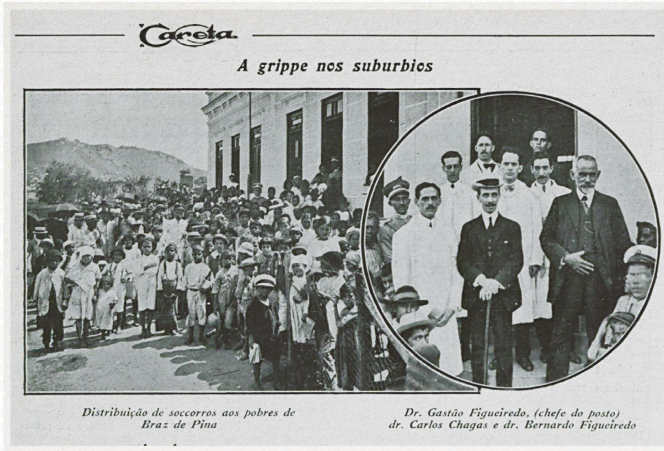
Fotografias publicadas na revista Caretta de 16.11.1918 retratando a situação no Rio de Janeiro. Na fotografia da direita, aparece o doutor Carlos Chagas.

A ampla vitória de Rodrigues Alves e Delfim Moreira no pleito presidencial realizado em 1º de março de 1918 foi considerada pelo Congresso Nacional, por ocasião da emissão de parecer sobre o resultado do pleito, não uma eleição – concorrida entre vários candidatos e com o voto disputado até mesmo com violência em algumas situações –, mas uma “aclamação”! Essa concepção se deve ao fato de eles terem sido únicos candidatos com a quantidade majoritária de sufrágios que receberam. Os demais votados foram sufragados pelos eleitores sem serem candidatos, o que era permitido pela lei eleitoral da época. Também é importante ressaltar que Rodrigues Alves foi o único presidente eleito duas vezes em quatro décadas da Primeira República. Apesar disso, não exerceu o último mandato.