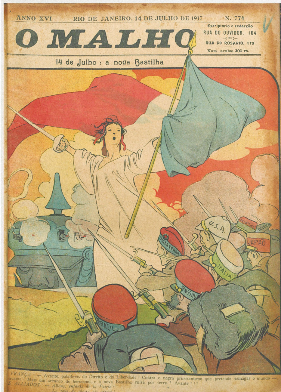
Capa da revista O Malho de 14.7.1917 aludindo à Primeira Guerra Mundial.

Em meados de 1916, ou seja, na metade do mandato de Wenceslau Brás, as oligarquias já se movimentavam para a escolha do futuro presidencial. Para os paulistas, tratava-se de nova oportunidade para enviar mais um dos seus à Presidência, afinal, desde 1906 não ocupavam o Catete. O último presidente proveniente de São Paulo havia sido Rodrigues Alves (1902-1906), e a distância do principal posto executivo em vários momentos ao longo desse período havia colocado os paulistas em situação de desvantagem com relação às decisões da economia nacional, especialmente às relacionadas com a produção e comercialização do café, o então principal produto desse estado e da nação.