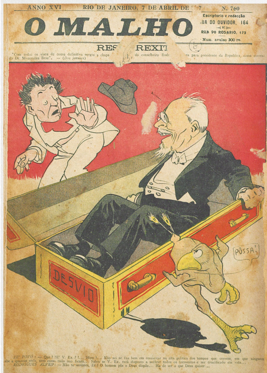
Capa da revista O Malho de 7.4.1917 que ironiza a possível candidatura do velho Rodrigues Alves à presidência.

Também pesava para a escolha de Rodrigues Alves as opções reduzidas, à época, para a Presidência. O alto escalão da primeira geração de políticos da República já havia tido grandes perdas em função do avançar de suas idades, o que influenciou para a rápida escolha do candidato para o pleito de 1918. A restrição das opções no mercado político também fez com que a escolha recaísse sobre dois indivíduos com saúde frágil.