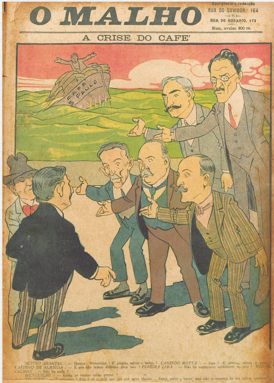
Charge da revista O Malho de 30.6.1917 com a representação da discussão entre as lideranças paulistas e o Presidente Wenceslau Brás sobre a crise do café.

Em termos políticos, o momento era favorável para os paulistas. Um dos principais articuladores das eleições no país, o Senador Pinheiro Machado, gaúcho, havia saído de cena em 1915, quando foi assassinado por um louco no saguão de um hotel no Rio de Janeiro. Esse fato fez com que o Rio Grande do Sul perdesse força no cenário político, pelo menos no que se refere à projeção de um dos seus representantes para o Catete. Minas Gerais, por sua vez, não teria como indicar um sucessor de Wenceslau. Tal situação não seria bem recebida pelas lideranças de outros estados, pois Minas havia ocupado a Vice-Presidência no mandato de Hermes da Fonseca e se mantinha no Executivo na gestão seguinte, com o próprio Brás.