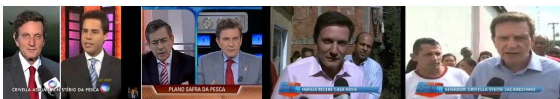
Figura 2 - Em entrevista na RJ Record; ao programa Entrevista Record Atualidades; E no programa Balanço Geral, apresentado pelo dep. estadual Wagner Montes (RJ), ao entregar uma casa nova a uma moradora do Morro da Providência e em visita ao bairro Jacarezinho.

Crivella lançou treze discos, que tiveram relativo sucesso no mercado fonográfico evangélico. Em 2002, o bispo foi eleito para senador com 3.243.289 votos, pelo Partido Liberal, pelo estado do Rio de Janeiro. Sua vida não é diária com a televisão, como é o caso de Russomanno, mas sua agenda de compromissos é coberta pela rede.