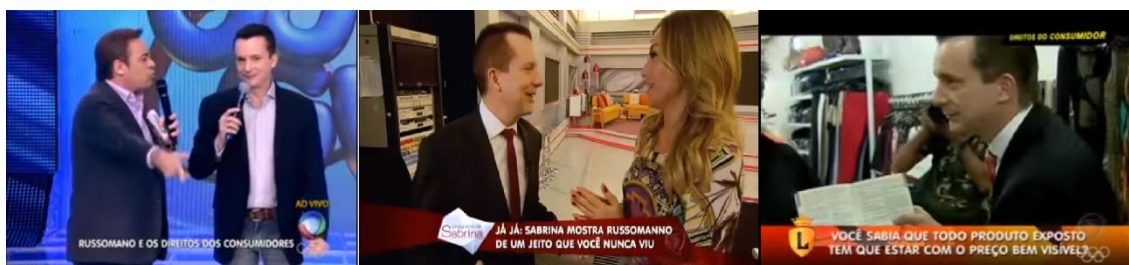
Figura 1 - Celso Russomanno no Programa do Gugu, no Programa da Sabrina e no programa Legendários, da Rede Record.

A pressão midiática exercida pela equipe de televisão é passo determinante para que os casos sejam resolvidos. Para evitar a construção negativa da própria imagem, empresas e setores públicos cedem às reivindicações apresentadas pela emissora. O apresentador também é convidado de programas da emissora, ocasiões em que tem larga oportunidade de destacar aspectos de sua vida privada, qualidades como interlocutor de interesses da população, conforme apresentamos na figura 1.