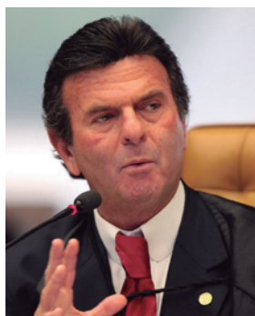
O relator do processo, ministro Luiz Fux, foi acompanhado pela maioria.