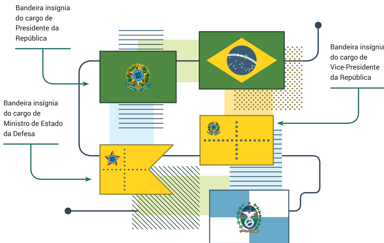
Ilustração: Bruno Lima (EJE)

Já a Bandeira Insígnia do Ministro de Estado da Defesa, foi instituída pelo Decreto nº 6.941, de 18 de agosto de 2009, publicado no D.O.U. de 19/08/2009.