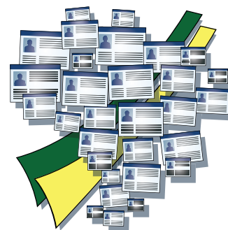
Ilustração: Julio Lima (EJE)