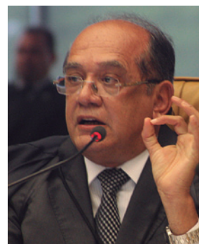
Com o pedido de vista do ministro Gilmar Mendes, o julgamento foi suspenso.