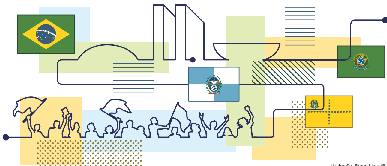
Ilustração: Bruno Lima (EJE)

Aprovada há 15 anos, a Lei 9.840/99 aumentou o rigor na punição à compra de votos