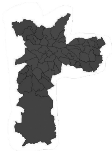
Figura 6. Eleições de 2008 – 2º turno

Apesar de descreverem bem a estabilidade do eleitorado em relação a sua divisão entre votos para a esquerda e para a direita, e a relação entre voto na esquerda e bairros periféricos e mais pobres, e voto na direita e bairros de classes médias e altas, o artigo de Limongi e Mesquita não discute a razão que leva tais pessoas a votar em um ou outro partido. Já Pierucci tenta formular explicações sociológicas para compreender o voto de direita entre as camadas médias e baixas da população, mas não deixa muitas pistas acerca das razões que levaram os mais pobres a votar em Erundina em 1988, talvez porque, como bem apontou Limongi, parte desses eleitores tenham optado por Maluf na eleição seguinte, o que parece confundir bastante as coisas. De qualquer forma, o argumento realizado por Limongi e Mesquita (2008) a respeito da estabilidade eleitoral que passaram a ter tanto o PT quanto o PSDB na cidade parece ter se confirmado nas últimas eleições de 2008 e de 2012: