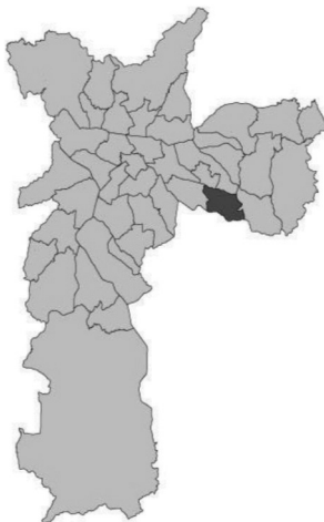
Figura 3. Eleições de 1992 – 2º turno

Na eleição de 1992, após a prefeitura de Erundina, o PT perdeu parte de seu eleitorado entre aqueles das camadas mais pobres para o malufismo, contrariando a esperança de que um governo voltado para os mais pobres faria que essas pessoas passassem a ser eleitores fiéis do PT. Com a vitória em 1992 de Paulo Maluf, e em 1996 de seu sucessor Celso Pitta (vide Figuras 3 e 4), com o apoio dos eleitores de centro, segundo os levantamentos estatísticos realizados pelos autores, a caracterização do PT como partido opositorista e popular passa a ganhar força, e o PT começa a se enraizar entre os eleitores de baixa renda e baixa escolaridade, ao mesmo tempo que os eleitores de escolaridade alta passam a preferir o PSDB.