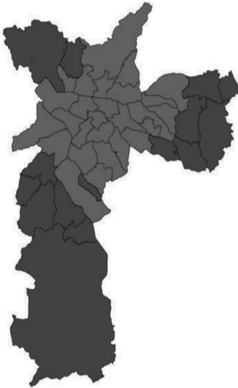
Figura 5. Eleições de 2004 – 2º turno

esforço muito maior para recrutar novos eleitores em relação ao cenário eleitoral passado, vide mapa eleitoral abaixo.