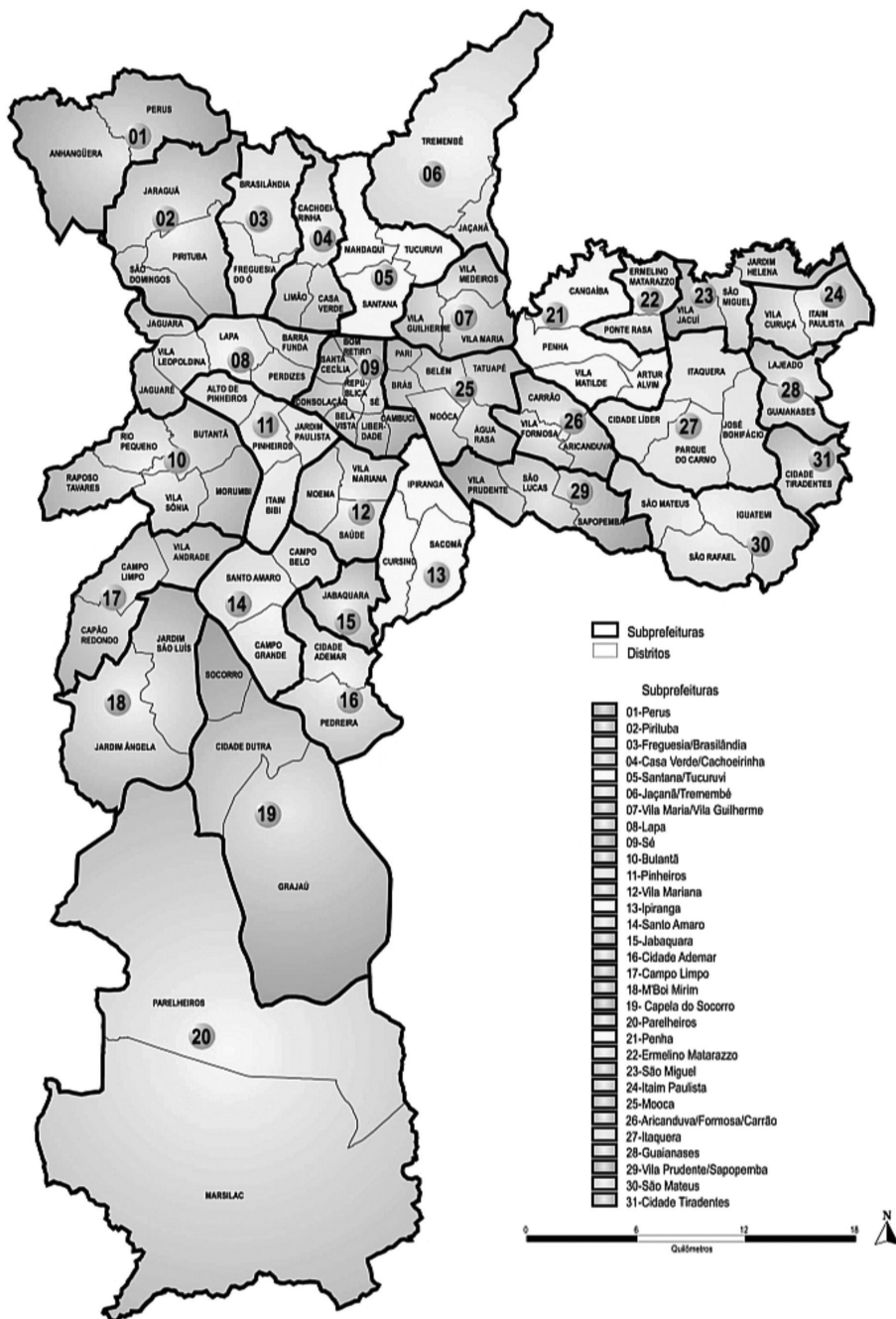
Figura I. Mapa da cidade de São Paulo.