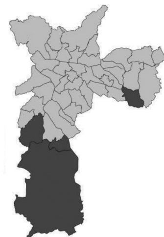
Figura 4. Eleições de 1996 – 2º turno

escolaridade, e uma parcela de eleitores, provavelmente centristas, abandona o voto no PT e adota a preferência pelos tucanos. Diante dessa movimentação, no segundo turno em 2000, que ficou entre Marta Suplicy do PT e Maluf, 52,1% dos eleitores do PSDB votaram no PT, e 28,4% votaram no ex-arenista. Segundo os autores, nem todos os eleitores malufistas que haviam optado pelo PSDB em 2000 voltaram a votar em Maluf no segundo turno. Nessa eleição, Marta Suplicy teve a maioria dos votos em todos os distritos da capital paulista.