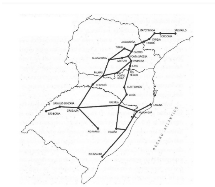
Figura 2 - Mapa ilustrativo do Caminho das Tropas entre os séculos XVIII e XIX.

Foi dessa maneira que surgiram diversas fazendas e povoadamentos nas áreas de campo no próprio Rio Grande do Sul, Santa Catarina, Paraná e São Paulo, visto que essa era a principal rota que interligava a rede de caminhos para o deslocamento entre esses estados.