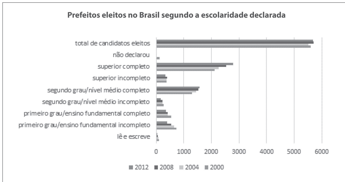
Gráfico 2: comparativo de prefeitos eleitos no Brasil segundo a escolaridade declarada

O número de candidatos eleitos com nível superior de escolaridade, embora sempre fosse maioria no lapso temporal analisado, foi o que mais aumentou em termos percentuais.