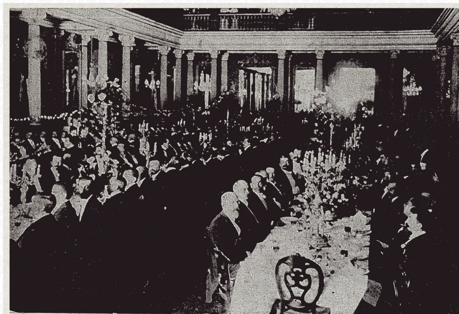
Banquete oferecido pela Colligação aos Drs. Afonso Penna e Nilo Peçanha, futuros presidente e vice-presidente da Republica