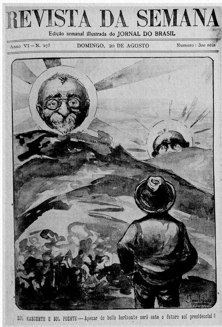
Capa da Revista da Semana de 1907, nº 275, p. 3, a respeito do nascimento da candidatura Afonso Pena.

O Presidente Rodrigues Alves planejava indicar seu sucessor. Mal sabia ele que isso criaria grande descontentamento nas principais oligarquias dominantes da Federação, a saber: Minas Gerais, Rio Grande do Sul, Bahia, Pernambuco e Rio de Janeiro. Sondagens, tensões, articulações e diversas trocas de missivas marcaram a indefinição da candidatura oficial, que variou de temor de novas revoltas ao consenso de uma chapa única. Verdadeira guerra de nervos, e tudo nos bastidores!