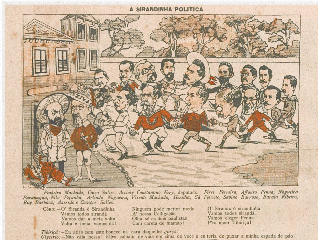
O Malho de 1905, nº 158, p. 28. Ciranda política: o bloco exclui os paulistas.

Isso ficou comprovado nos anos seguintes, quando Afonso Pena agiu no mesmo sentido que Rodrigues Alves, tentando indicar David Campista como seu sucessor. Logo, as sucessões presidenciais da Primeira República ocorreram via acordos efêmeros de estabilidade, o que, em certo sentido, não impediu a crise dos anos 1920 e a posterior debacle desse modelo político, em 1930.