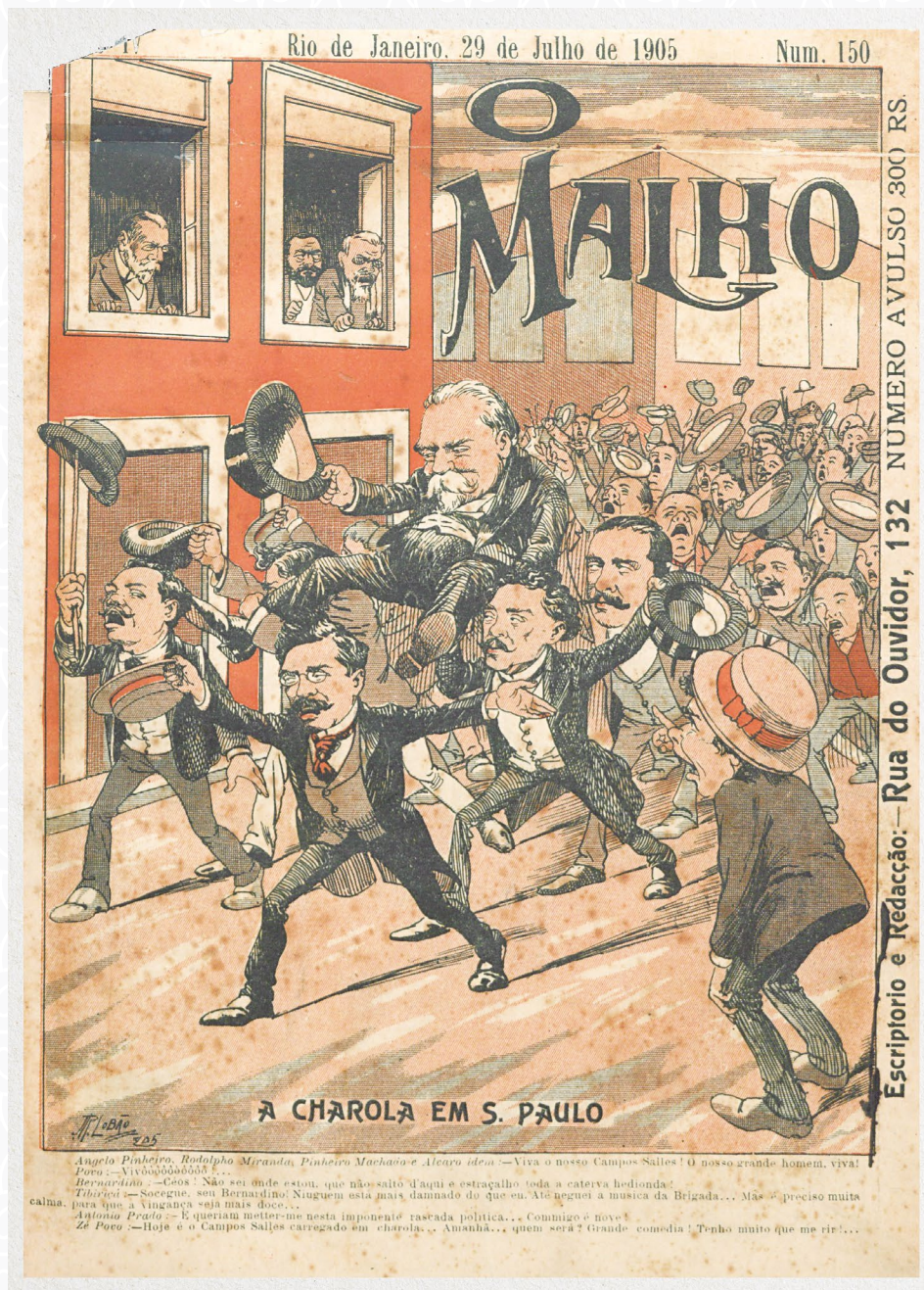
Capa d'O Malho de 29.7.1905, nº 150, p. 1, anunciando a defesa da candidatura de Campos Salles por Pinheiro Machado.

autopromoção, o segundo lograva complicar o jogo, dividindo o PRP ao lançar a candidatura de Campos Salles. Entretanto, ambos traduziam o veto de boa parte das oligarquias dos demais estados, que transitavam da aceitação da escolha proferida pelo Catete ao lançamento de candidaturas alternativas, de essência contestatória.