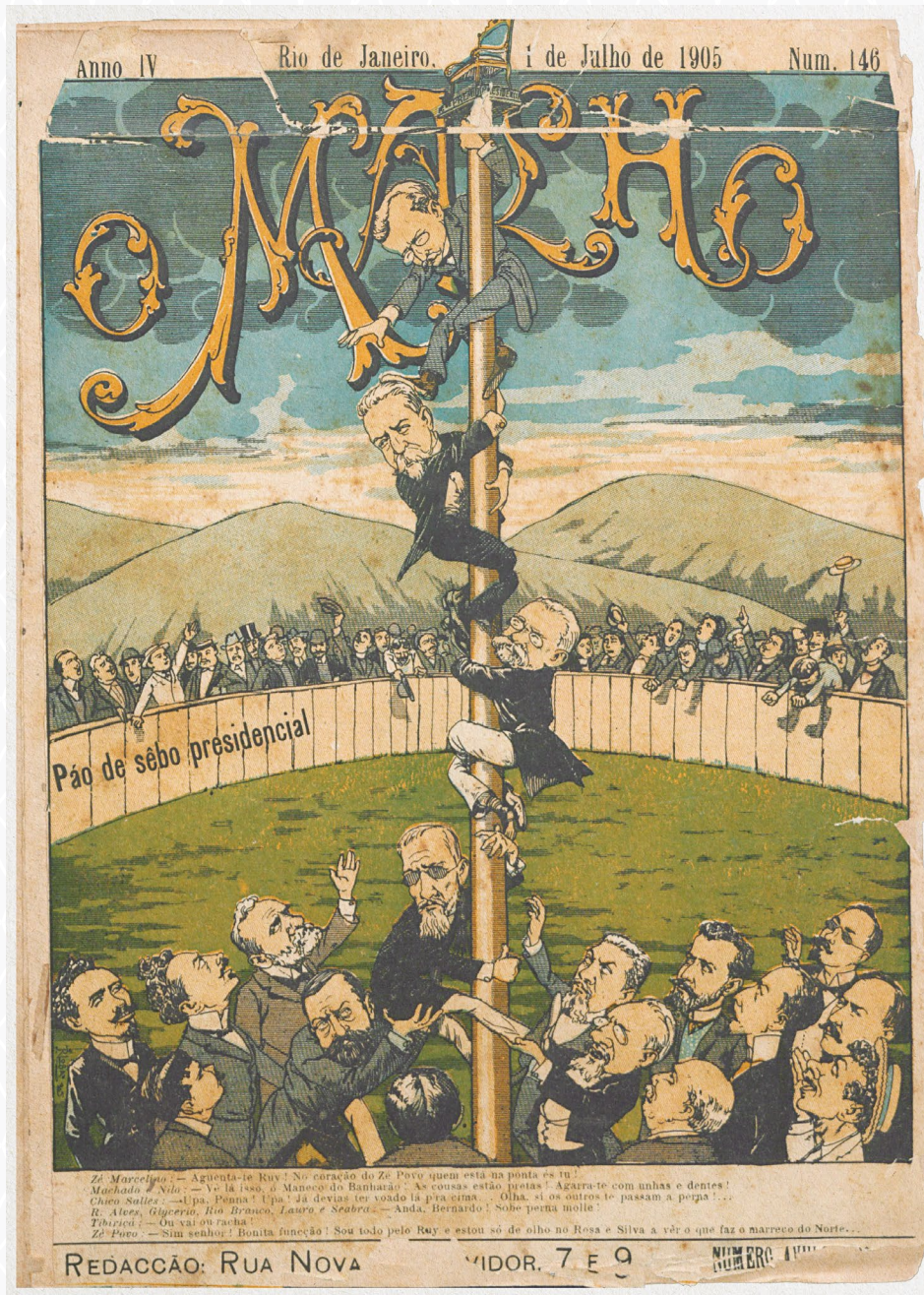
Capa d' O Malho de 1º.7.1905, retratando a acirrada disputa em torno da presidência.

Contudo, antes que o processo sucessório ganhasse tons dramáticos e complexos, ele começou a ser deflagrado ainda em 1904, na visita que Rodrigues Alves fez a Minas Gerais para uma inauguração. Tal atitude era tida como a certeza do apoio do Catete à candidatura mineira do então vice-presidente, o que de forma nenhuma era o desejo da elite política paulista. Não por acaso, meses depois da visita, Alves, em correspondência escrita a Afonso Pena em março de 1905, justificava sua opção pela escolha do nome de Bernardino de Campos e pedia a seu vice o apoio, de modo a evitar divergências e animosidades na convenção republicana que deveria homologar aquele nome.